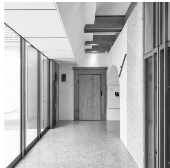
PLEČNIKOVA HIŠA, Ljubljana, 2015