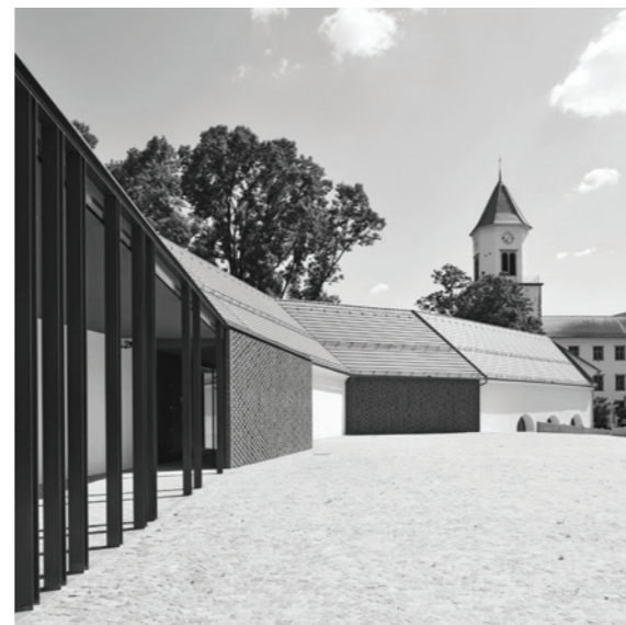
GRAJSKA PRISTAVA, Ormož, 2010